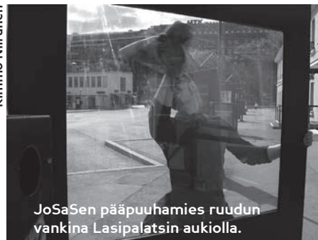
JoSaSen pääpuuhamies ruudun vankina Lasipalatsin aukiolla.