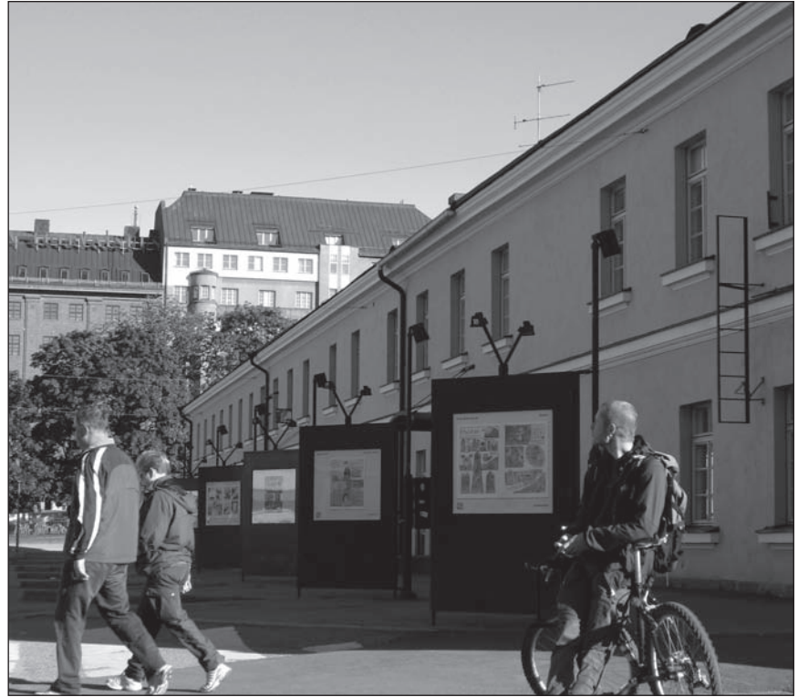
Eessuntaassun Lasipalatsin aukiolla.

valehtisiä. Tilanteemme on siis mielenkiintoinen; toisaalta albumimme ovat liian näyttäviä (ja kalliita) pienlehdiksi ja toisaalta liian vaatimattomia kilpailemaan edes pienkustantajien kanssa. Pienoinen ristiriita sanoisin. Jotenkin sitä toivoisi,