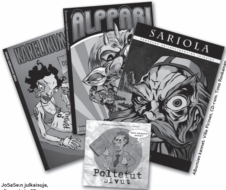
JoSaSe:n julkaisuja, albumeja ja CD-rom.

Seura on kroonisen persaukinen ja kaikki albumeista saadut myyntitulot menevät lyhentämättöminä seuraavaan sarjakuvaprojektiin. Leijonanosan seuran käteisvaroista haukkaavat aina painokustannukset ja markkinointi. Jossain määrin satsataan myös näyttelytoimintaan, uuden ja laajemman lukijakunnan toivossa. Voihan olla, että sarjakuvanäyttelyyn eksyy ihminen, joka ei ole seurasta ikinä kuullutkaan. Jos sellainen nyt on ylipäättäen edes mahdollista. Sekin on tietysti pakko myöntää, että tällaisella voittoa tavoittelemattomalla toiminnalla ei näitä projekteja toteutettaisi, elleivät paikalliset apurahalautakunnat antaisi seuran toiminnalle mitään arvoa.