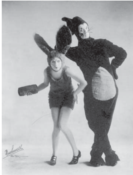
Krazy Kat kääntyi eriskummallisesti jazz-baletiksi.

Sarjakuvista tehtiin yksittäisiä musiikkikappaleita jo varhain, useimmiten puhtaan liikevoiton tavoittelun nimissä. Ei ole mieltä luetella kaikkia sarjakuvahahmoista ja sarjoista tehtyjä