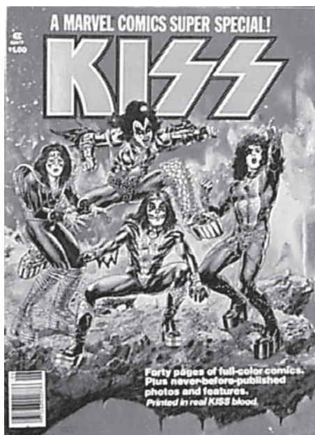
Kiss-yhtyeen sarjakuvalehden painomusteeseen oli lisätty yhtyeen verta!

Ideana sarjakuva-soundtrackia voisi pitää periaatteessa hyvänä, mutta käytännön ongelmiin törmätään heti suunnitteluvaiheessa. Sarjakuvan lukemistapahtuma on yksilöllinen eikä etene ennakoidusti, saati edes lineaarisesti. Musiikin ja kuvien synkronointi on