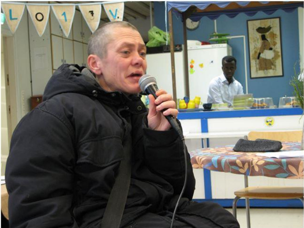
"Laula kanssain." Silta-projekti on tarjonnut monenlaista tekemistä ja toimintaa.