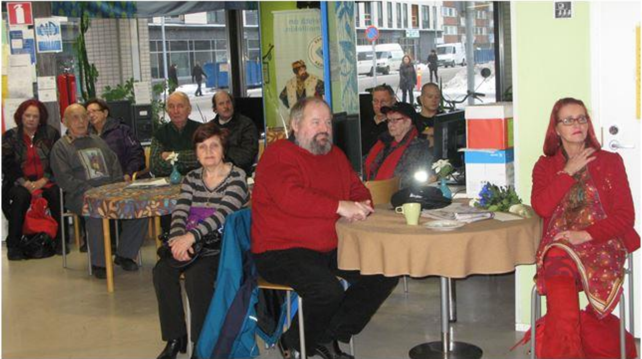
Kansalaistalon 17-vuotisjuhla on kerännyt jälleen ihmisiä yhteen.

Soroppi ry. on kuluneena vuonna toiminut Kansalaistalon toimitiloista käsin. Sitä on yhdessä ylläpidetty Pohjois-Karjalan Sosiaaliturvayhdistys ry:n kanssa. Eri tapahtumien ja toimintojen kautta on jalkauduttu eri kohtaamispaikkoihin, kauppakeskuksiin sekä kaduille ja puistoihin Joensuun kaupungin alueella.