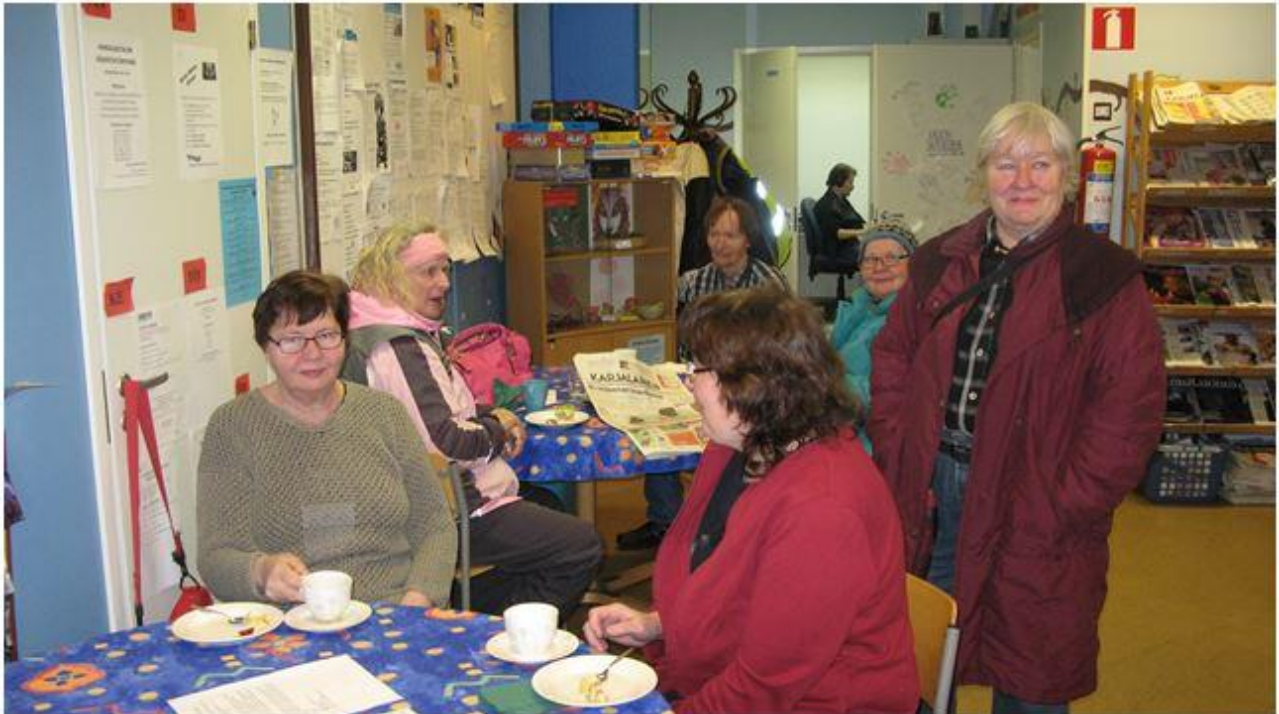
Kansankahvila on ollut monelle hyvä kohtaamispaikka.